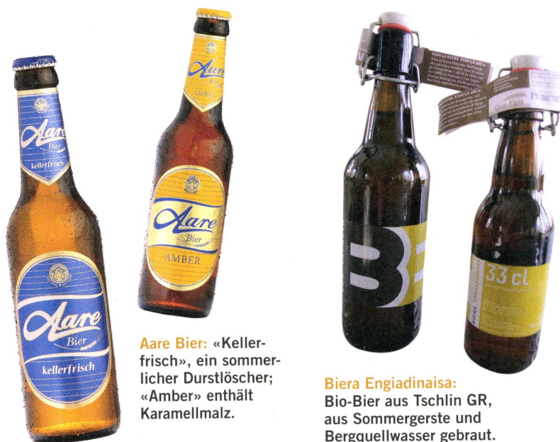
Aare Bier: «Kellerfrisch», ein sommerlicher Durstlöcher; «Amber» enthält Karamellmalz.