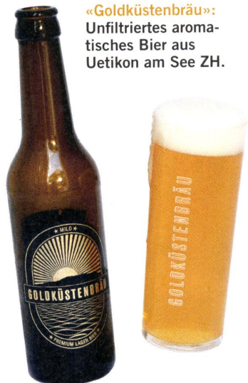
«Goldküstenbräu»: Unfiltriertes aromatisches Bier aus Uetikon am See ZH.