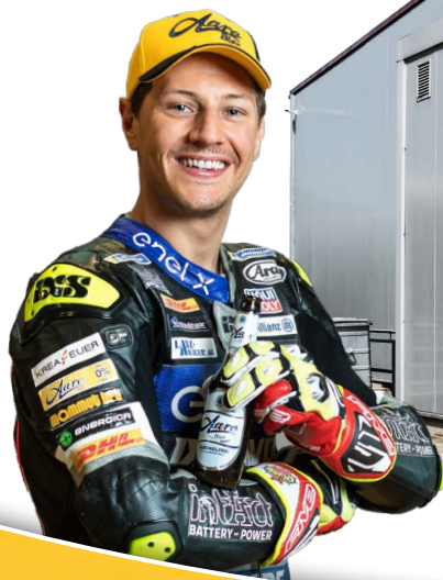
Unser Markenbotschafter Doppel-Weltmeister Dominique Aegerter

Das hochwertige Aare Bier: Traditionelle Braukunst, modernste Technik, regional verankert.